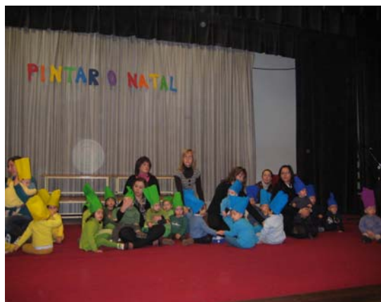
■ Durante as apresentações