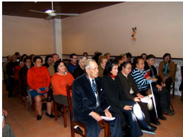
■ Grupo de idosos que assistiu à celebração

A alegria e o convívio estiveram sempre presentes, assim como a boa disposição, dos 45 idosos e familiares que deram um pezinho de dança antes da chegada do Pai Natal, que a todos presenteou com ofertas de Natal da Fundação Bomfim.