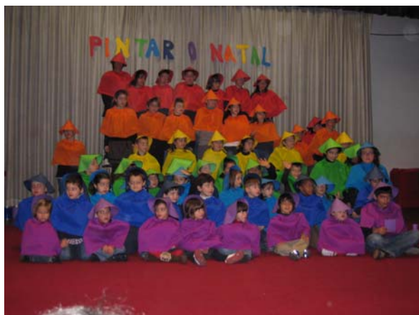
Todas as crianças pintaram de forma divertida o Natal ■

O Natal está à porta e como é habitual nesta época, no Departamento Infantil, todos estão atarefados. O mês de Dezembro é uma azáfama: são os presentes para oferecer às crianças e aos pais, são os ensaios para que na Festa de Natal tudo aconteça como planeamos, enfim um corre-corre muito gratificante.