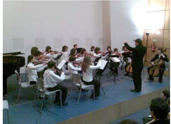
Orquestra de Câmara da Companhia da Música

Entretanto, já no próximo dia 5 de Janeiro, às 17h30, decorre o Concerto de Ano Novo, no Auditório do Museu D. Diogo de Sousa, contando com a participação de diversos professores da Companhia da Música.