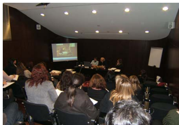
Auditório da Agere

O Workshop foi realizado pelo Grupo de Trabalho da Terceira que abarca a REAPN, a Fundação Bomfim, a Casa de Saúde Bom Jesus, a Santa Casa da Misericórdia da Póvoa de Lanhoso, a ADCL, a Cruz Vermelha Portuguesa, o Centro Social e Paroquial de Cerveães.