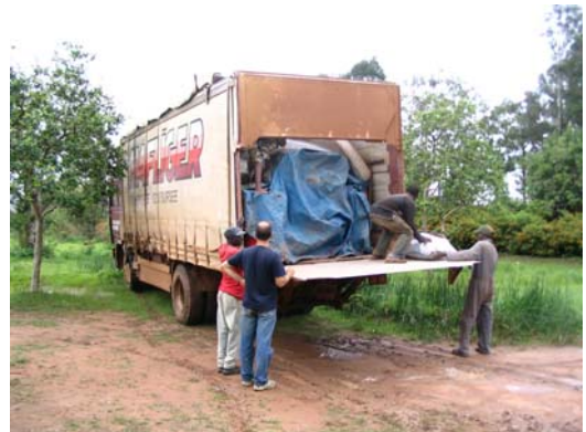
Descarga dos materiais doados

Gradualmente o ensino passará a abranger crianças de outras idades até incluir o ensino obrigatório (que em Angola vai até ao 6º ano). Pode obter mais informações visitando a página da Fundação Bomfim em www.bomfim.org ou solicitando a newsletter para cesta@bomfim.org .