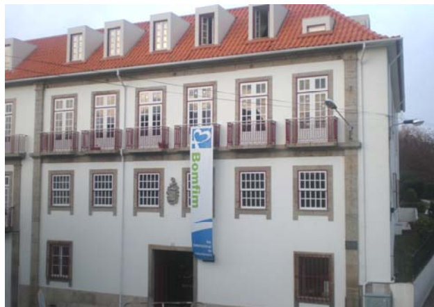
Fachada da Fundação

O mês de Dezembro, não é só marcado pelo espírito do Natal. Há um dia muito especial comemorado no dia 5 – o dia em que se celebra todo o trabalho, dedicação, amor ao próximo de todos os voluntários.