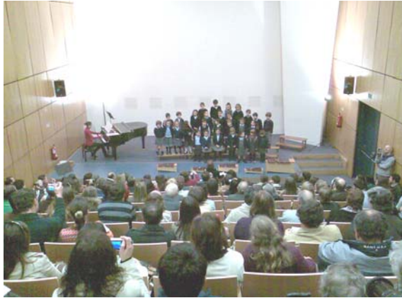
Audições de Natal no Museu D. Diogo de Sousa

As audições de Natal da Companhia da Música decorreram com grande sucesso entre os passados dias 13 e 16 de Dezembro no Auditório do Museu D. Diogo de Sousa, em Braga.