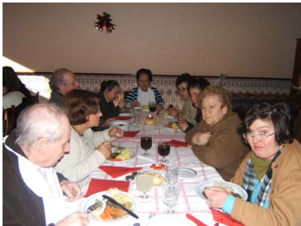
Almoço de Natal que antecedeu o programa da festa ■

Os idosos, familiares e colaboradores vibraram no passado dia 12 de Dezembro com a celebração do Natal que decorreu no nosso edifício sede no espaço do Centro de Dia e refeitório.