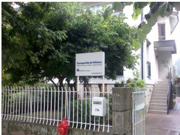
Entrada da Companhia da Música ■

O mês de Julho na Companhia da Música está repleto de actividades, havendo oportunidade de assistir a recitais, concertos, workshops, o I Concurso de Piano, uma visita guiada à Casa da Música, um Pedi Paper de Formação Musical e uma Ópera Infantil.