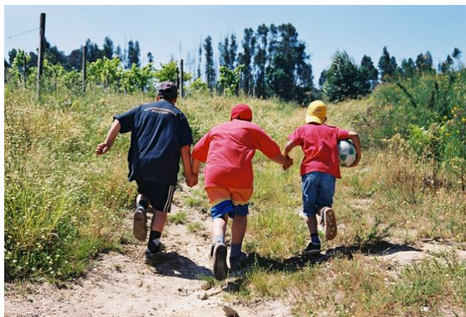
Minilares, uma resposta diferente de acolhimento ■

Desde Janeiro até ao presente recebemos cerca de 20 pedidos de internamento de crianças, oriundos de todo o país.