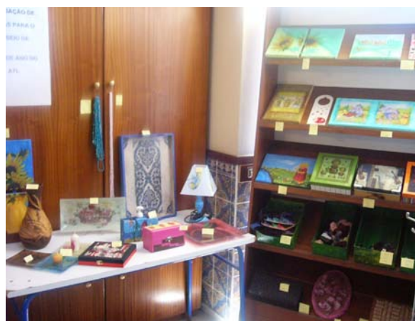
■ Bazar da Fundação Bomfim

Potenciando as aprendizagens adquiridas na formação, surgiu a ideia de elaborar trabalhos para vender no bazar da Fundação, com o propósito de angariar fundos para a aquisição de novo equipamento para o recreio.