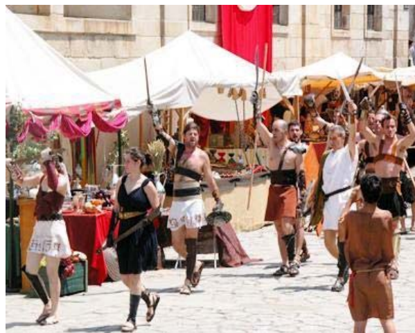
■ Cortejo Braga Romana

A cidade de Braga realizou mais uma vez a Braga Romana de 31 de Maio a 3 de Junho com grande fervor e participação de várias entidades. Um grupo de idosos do Centro de Dia vestiu-se a rigor e desfilou pelo centro da cidade, com centenas de crianças e jovens no cortejo etnográfico de abertura.