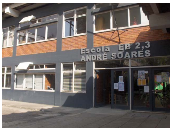
■ Fachada EB2,3 André Soares

O protocolo prevê diversas formas de cooperação, nomeadamente a dinamização de projectos pontuais na área da música, constituição de turmas na Escola EB 2,3 André Soares em Regime Articulado com os alunos da Companhia da Música, participação em eventos culturais de iniciativa da Escola EB 2,3 André Soares e detecção de vocações musicais nos alunos e encaminhamento para o ensino artístico especializado na Companhia da Música.