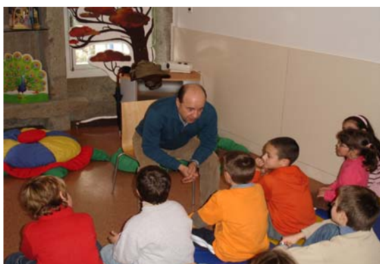
Histórias alegraram imaginário das crianças