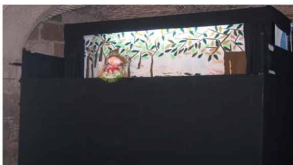
Espectáculo de Marionetas

Neste sentido, para enriquecer as actividades relacionadas com o Projecto Pedagógico que se intitula " Olhares" pela arte - Do Sentir ao Fazer ", 31 crianças da Fundação Bomfim, dos três aos cinco anos, partici-