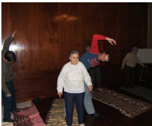
Uma aula de Yoga no nosso auditório ■

Para realizar os exercícios destas aulas, os idosos apenas necessitam de vontade e boa disposição porque, estes são possíveis de ser praticados e adaptados a todas as capacidades e debilidades.