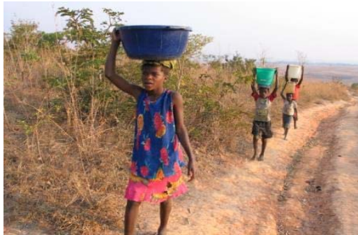
Projecto solidário para ajudar Angola ■

A Fundação Bomfim tem vindo a promover o projecto CESTA , dedicado à "Cooperação para o Desenvolvimento" em países carenciados, orientado para o melhoramento das áreas da Construção, Educação, Saúde, Testemunho e Agricultura.