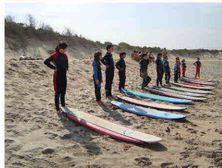
Aulas de surf

Foram 6 semanas muito intensas, mas repletas de alegria, prazer, amizade e boa disposição. Ficamos as saudades e o desejo de voltarmos a repetir a experiência brevemente. ■