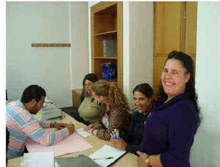
Acção de formação em Braga