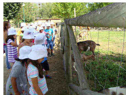
Visita à Quinta Pedagógica