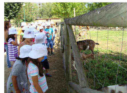
Visita à Quinta Pedagógica