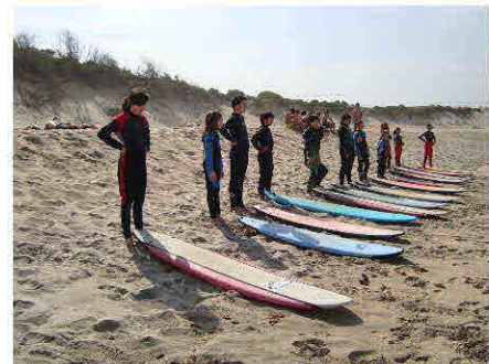
Aulas de surf

Foram 6 semanas muito intensas, mas repletas de alegria, prazer, amizade e boa disposição. Ficamos as saudades e o desejo de voltarmos a repetir a experiência brevemente. ■