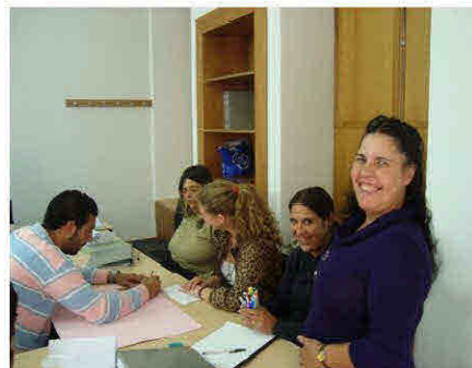
Acção de formação em Braga