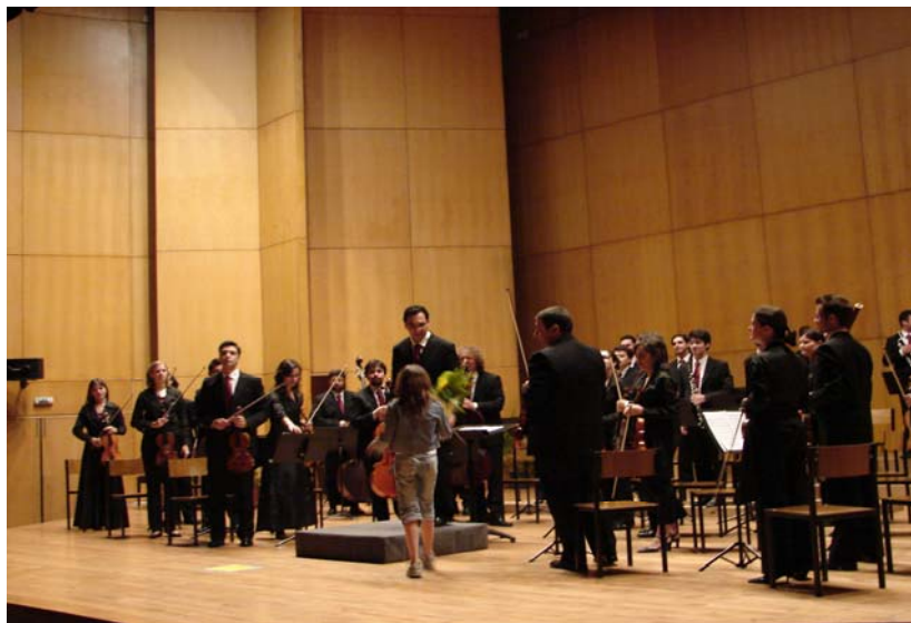
Orquestra brilhou no concerto inaugural ■