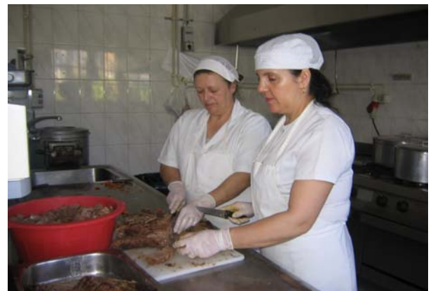
Qualidade e higiene nos serviços de cozinha ■