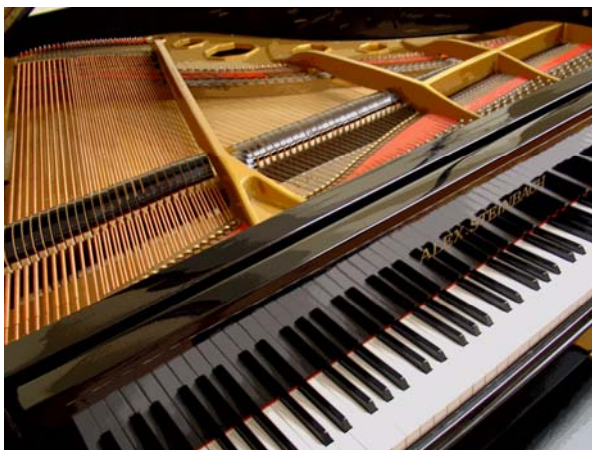
Companhia da Música viaja pelos sons ■