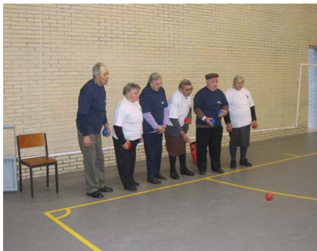
O Boccia tem encantado os idosos ■

Este Boletim pretende divulgar as actividades que a Fundação Bomfim desenvolve nas suas diversas áreas, dando voz a todos quantos nelas participam.