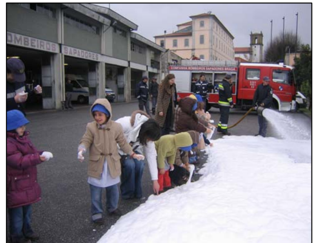
Uso de espuma nos incêndios dominou atenções