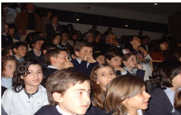
Alunos ao encontro da comunidade ■

O Dia Aberto da Companhia da Música decorre no próximo dia 22 de Abril no Museu D. Diogo de Sousa, em Braga, per-