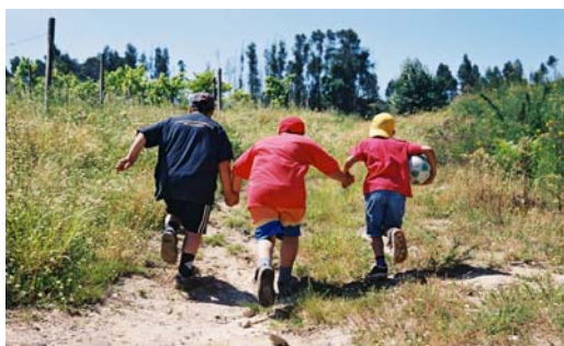
Crianças encontram novos caminhos nos Minilares

A problemática das “crianças de risco” ou “crianças vítimas” é uma constante nas páginas dos jornais ou noticiários televisivos. É um tema que vende, diria mais, é um assunto que está na moda, porque comove, abana as consciências e instituições, mas principalmente porque toca num dos nossos bens mais preciosos, senão o mais precioso: as CRIANÇAS!